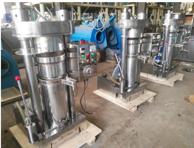
Упаковка перед экспортом