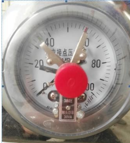
Манометр, максимальное рабочее давление 60 МПа