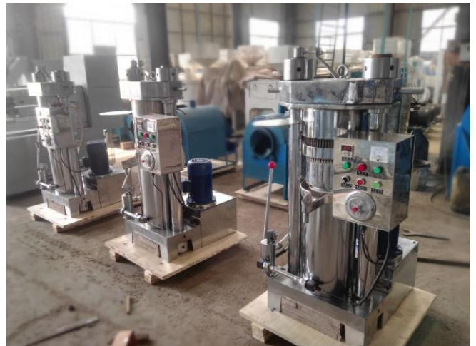
Упаковка перед экспортом