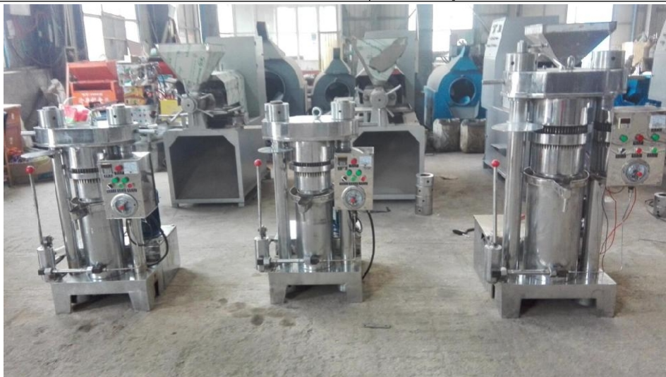
Вся машина будет проверена перед экспортом