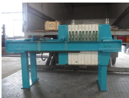
Ручной пластинчатый рамный фильтр