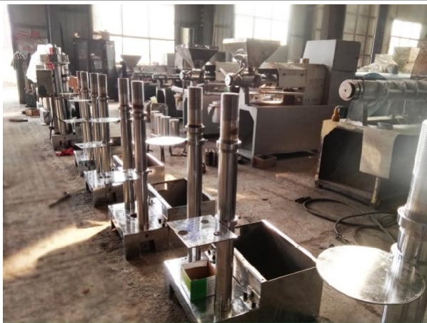
Сборка в мастерской