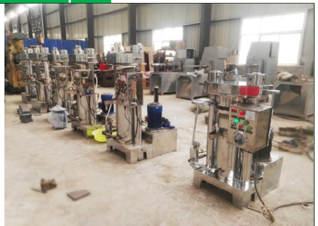
Вся машина будет проверена перед экспортом