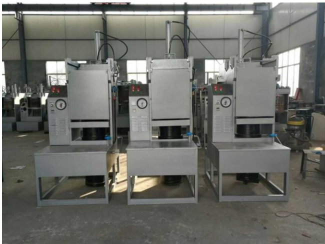
Гидравлический маслопресс большой производительности Z-500