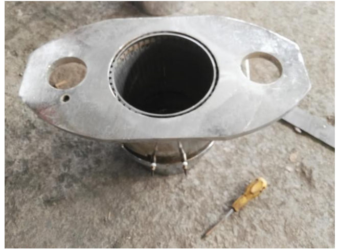
стальной материал цилиндра, также может настроить цилиндр из нержавеющей стали