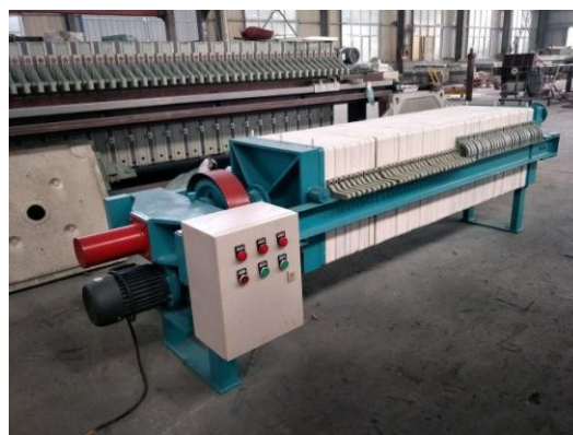
Гидравлический пластинчатый рамный фильтр