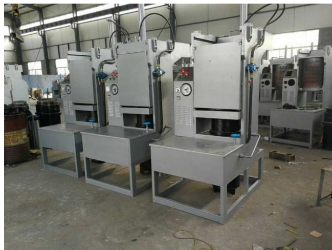
Гидравлический маслопресс большой производительности Z-500