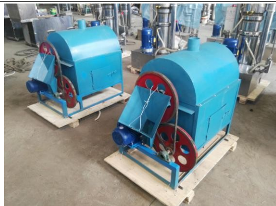
Жаровня с газовым нагревом